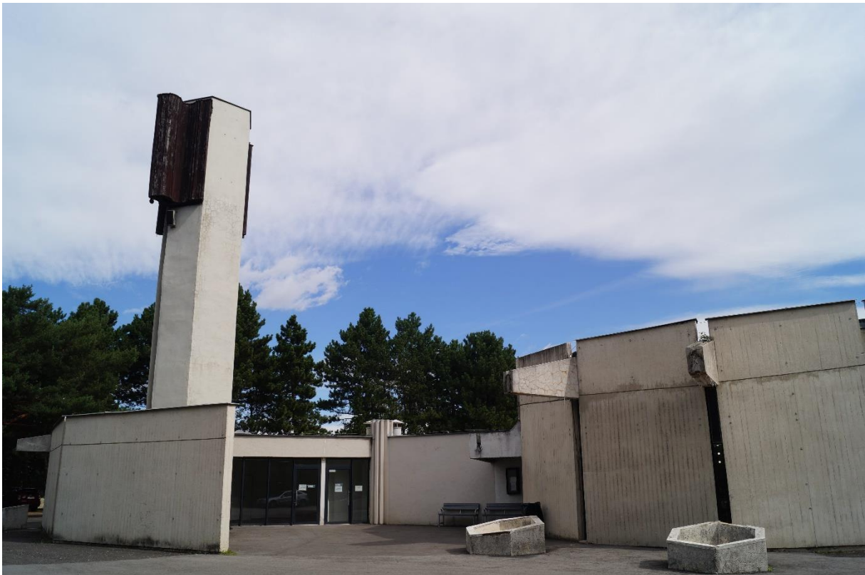
Cintorín Vrakuňa in Bratislava, Trauerhalle, 2020

Wie schon in Prag sind die meisten Grabmale vollständig mit polierten steinernen Platten belegt. Insgesamt darf, auch mit Hinweis auf die folgende Beschreibung des Zentralfriedhofs in Zagreb, gesagt sein, dass der finanzielle