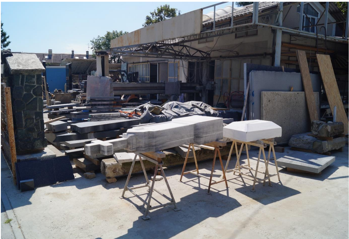
Mirogoj-Friedhof in Zagreb, Steinmetzbetrieb in der Nachbarschaft des Zentralfriedhofs, 2020, Foto: Martin Jeschke