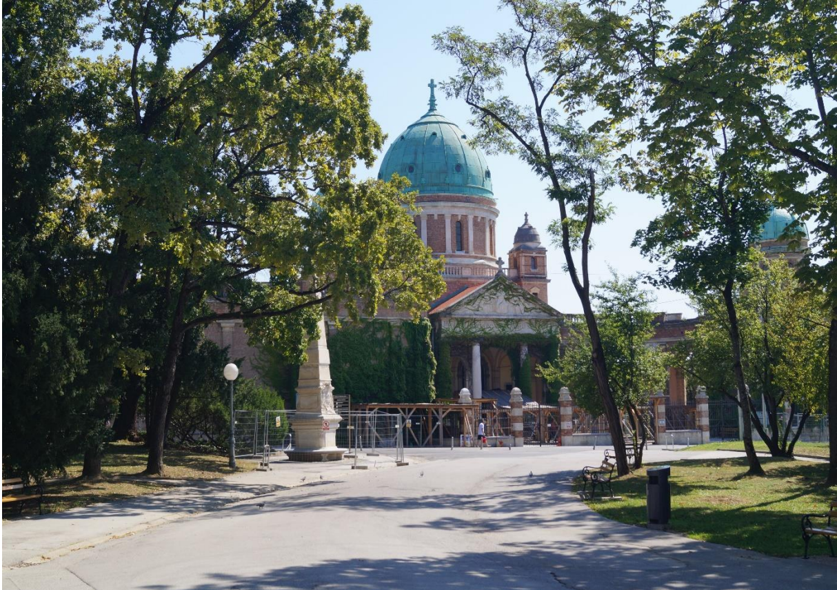
Haupteingang des Mirogoj-Friedhofs in Zagreb, 2020