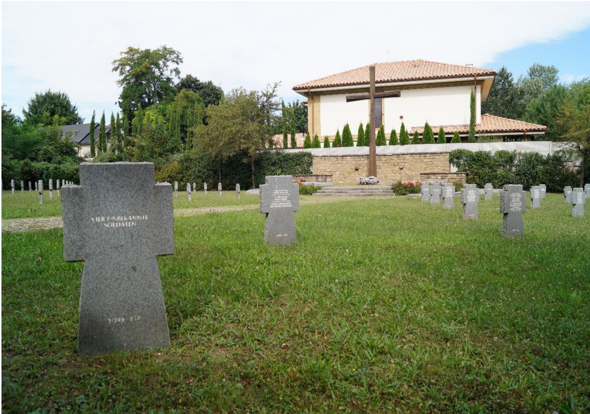
Cintorín Vrakuňa in Bratislava; Deutscher Soldatenfriedhof, 2020

der nicht mehr zu bergenden und zu identifizierenden Toten in Metalltafeln eingelassen.“ 2