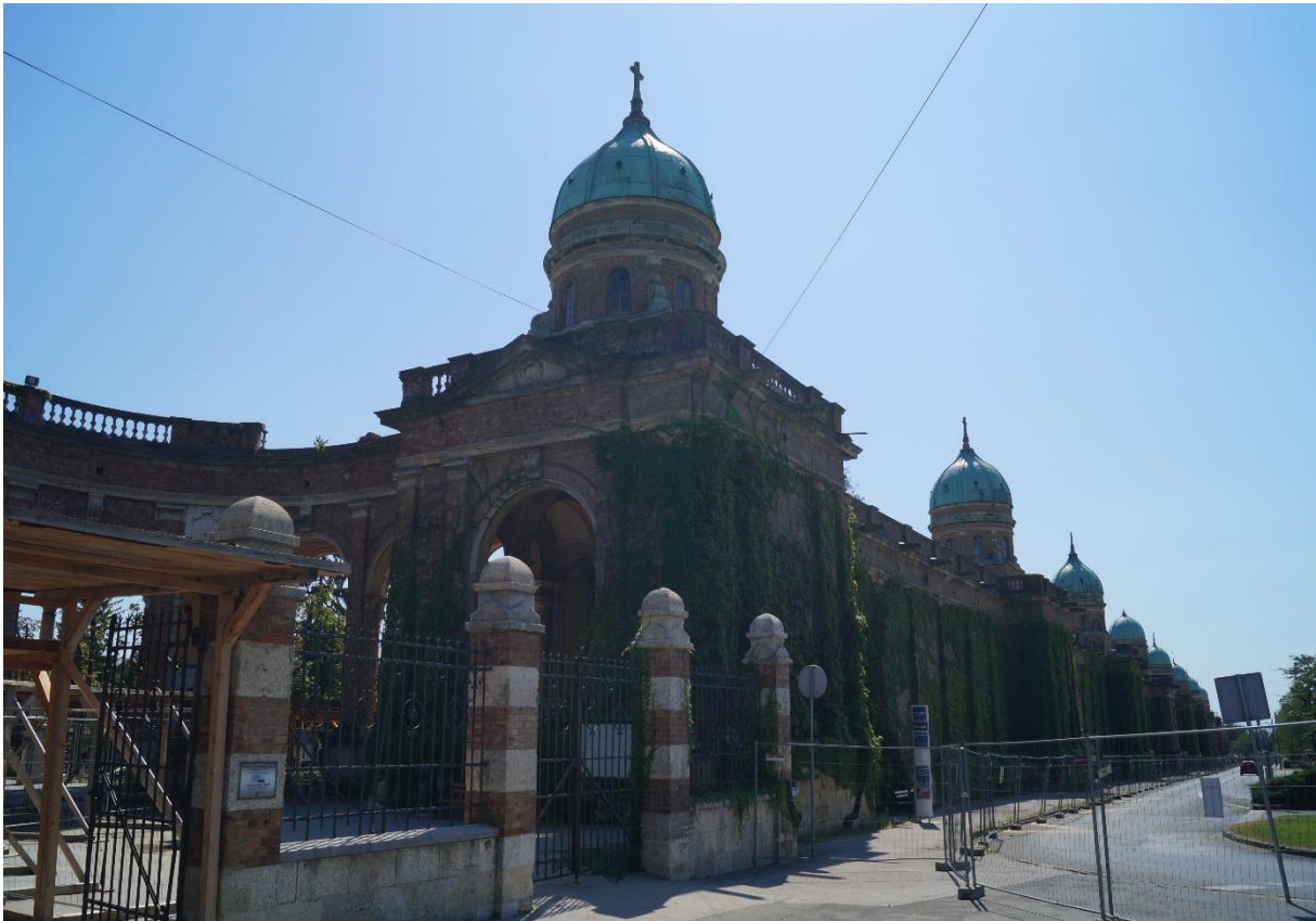
Mirogoj-Friedhof in Zagreb, Friedhofsmauer neben dem Haupteingang, 2020

Mirogoj liegt eine 15-minütige Straßenbahnfahrt vom Hauptbahnhof entfernt über der Stadt auf dem Hausberg Medvednica. Auf dem heute 72,4 ha großen Areal fand die erste Bestattung am 1.11.1876 statt. Der Bau der prägenden Gebäude wurde 1879 begonnen. Die Fertigstellung der Vielzahl von Kuppeln, Arkaden und der Kirche im Eingangsportal erfolgte 1929. Zum Zeitpunkt des Besuchs waren leider alle Gebäude aus Gründen der Einsturzgefahr mit Zäunen gesichert. Im März 2020 gab es ein Erdbeben, dessen Epizentrum nur wenige Kilometer nördlich der kroatischen Hauptstadt lag, bei dem es zu Schäden an vielen Friedhofsgebäuden und Gräbern kam.