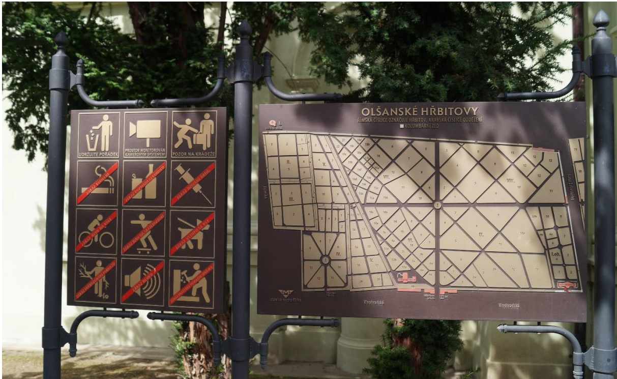
Lageplan und Hinweise am Eingang des Prager Zentralfriedhofs, 2020

Die Prager Nekropole beeindruckt mit ihrer Geschichte und den Kennzahlen. Im Jahr 1679 als Pestfriedhof angelegt, wurden zehntausende Opfer der Pestausbrüche der Jahre 1680, 1713-1714 und 1771-1772 im ältesten Teil des Friedhofs nahe der Kirche St. Roch bestattet. Die von 1786 bis 1917 ausgeführten Erweiterungen haben ihren Ursprung im Jahr 1784 als Joseph II. (1741-1790) die Bestattungen auf den Kirchhöfen der Stadt verbot; eine europaweit vergleichbare Geschichte, die vor allem in den hygienischen Notwendigkeiten begründet war. Heute besteht der Zentralfriedhof in Prag aus zwölf aneinandergereihten Einzelfriedhöfen, ergänzt durch einen neuen jüdischen Friedhof und einen Soldatenfriedhof. Seit seiner Gründung haben auf dem fünfzig Fußballfelder großen Areal über 2 Millionen Bestattungen stattgefunden.