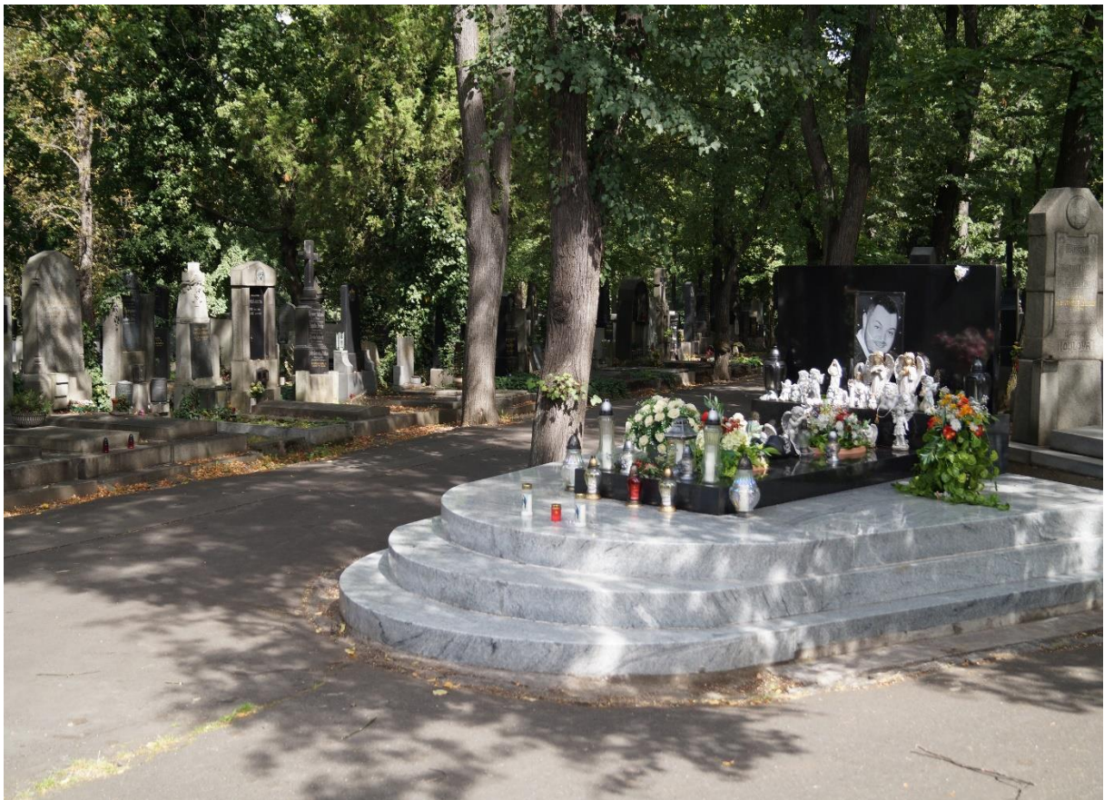
Prager Zentralfriedhof, Eckgrab eines kürzlich jung Verstorbenen, 2020, Foto: Martin Jeschke