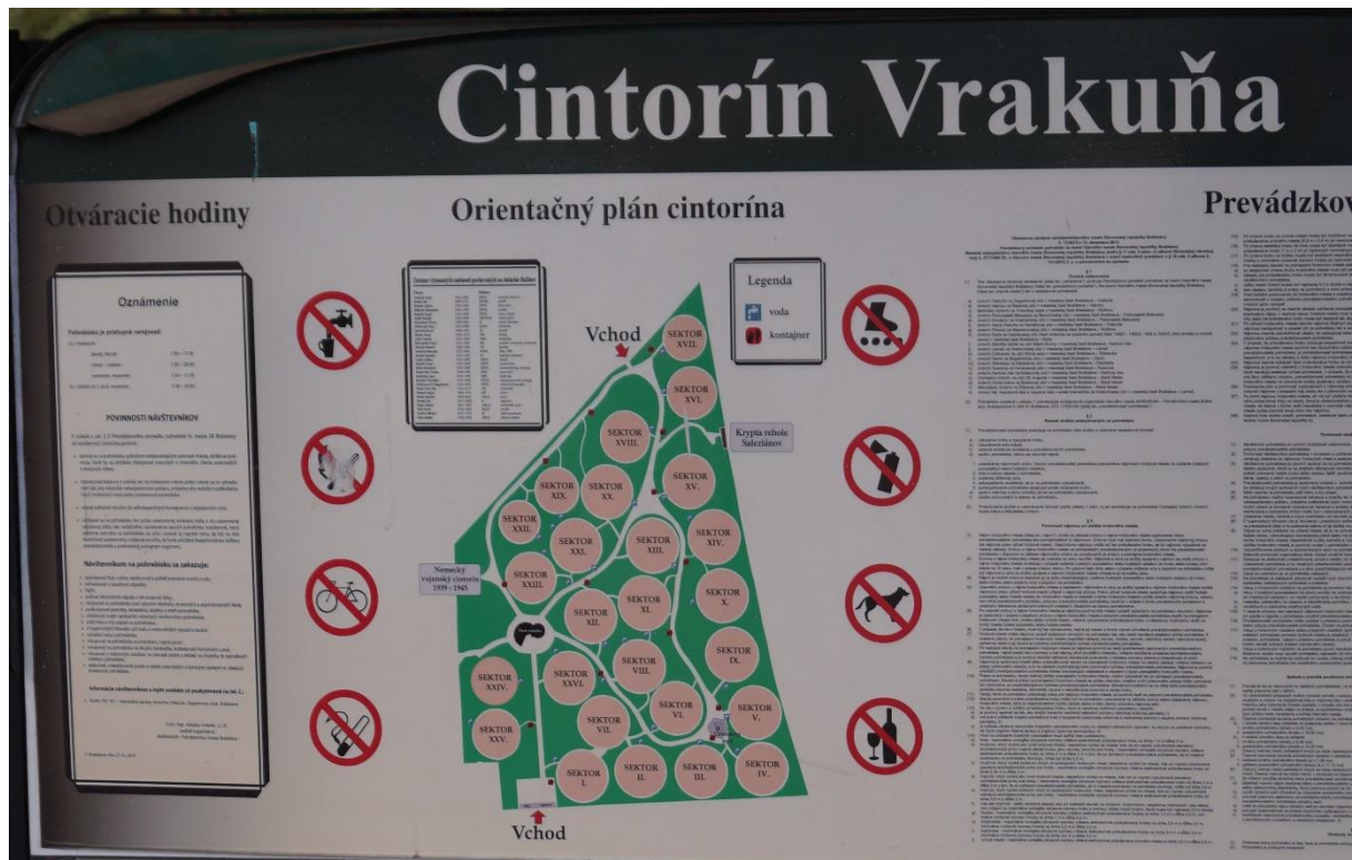
Cintorín Vraakuňa in Bratislava, Lageplan am Haupteingang, 2020

Der Bezirk Vraakuňa liegt ca. 15 min Fahrzeit von der Altstadt Bratislava entfernt. In Vorbereitung einer zukünftigen Erweiterung der Fläche des Zentralfriedhofs Bratislava wurde die Lage am Rand der Stadt gewählt. In Deutschland kam es aufgrund der veränderten Bestattungskultur nur selten zur Erweiterung der „neuen“ Friedhöfe an den städtischen Rändern. Der Cintorín Vraakuňa ist der jüngste der besuchten Friedhöfe und bildet einen Kontrast zu den historischen Friedhöfen der anderen Städte. Der Bau der Anlage begann im Jahr 1972, die ersten Bestattungen wurden 1980 durchgeführt. Auffällig ist die Gestaltung.