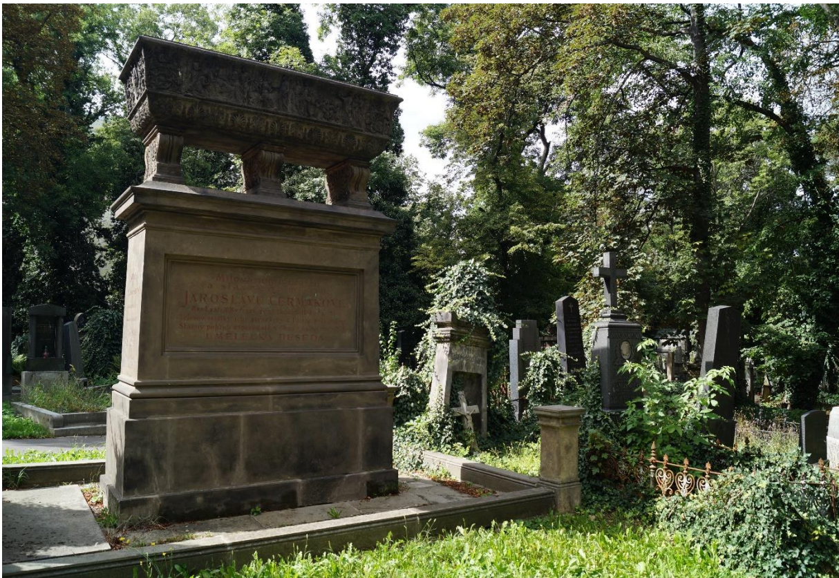
Prager Zentralfriedhof, Historisches Grabmal in Form eines Sarkophags, 2020, Foto: Martin Jeschke

Dank des auf Friedhöfen meist üblichen Schattens war ein dreistündiger Besuch im August 2020 möglich. Mehr als ein erster flüchtiger Überblick des Prager Zentralfriedhofs konnte dabei nicht gewonnen werden.