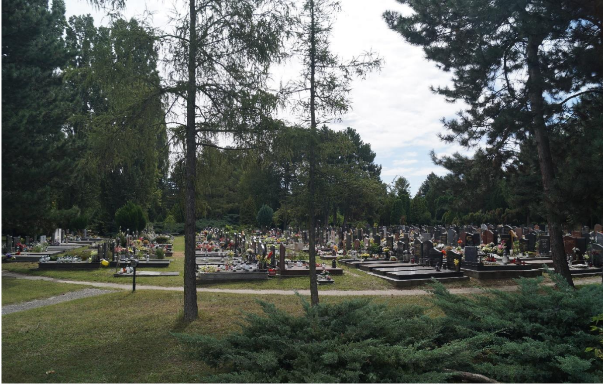
Cintorín Vrakuňa, Gerade Grabreihen in kreisförmigen Grabfeldern, 2020