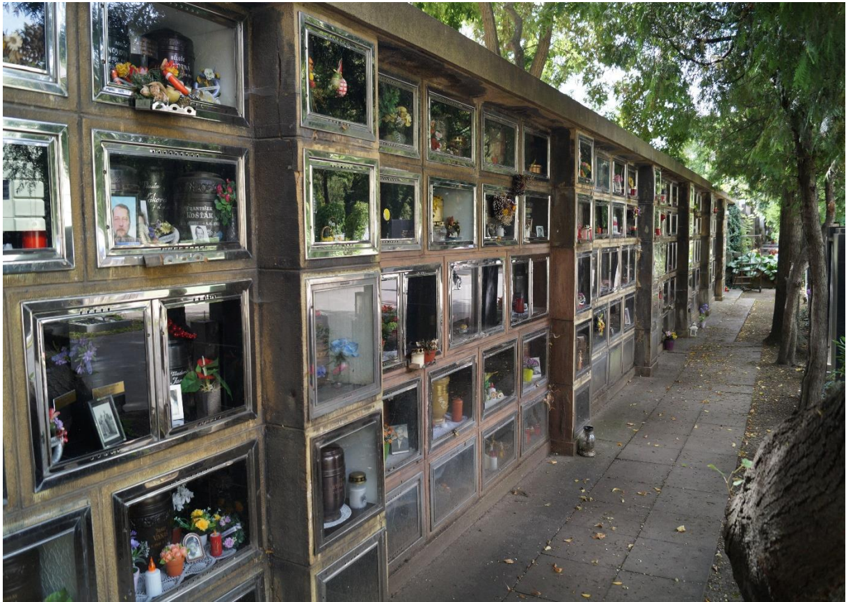
Prager Zentralfriedhof, Kolumbarium in der Friedhofsmauer, 2020, Foto: Martin Jeschke