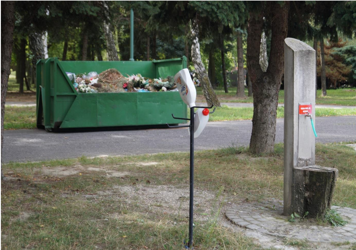
Cintorín Vrakuňa in Bratislava, Müllcontainer und Brunnen, 2020

Aufwand der Angehörigen für die Steinmetzarbeiten der Grabstellen deutlich über dem deutschen Durchschnitt liegt, was sich wohl nicht nur mit den Preisunterschieden begründen lässt. Für die florale Gestaltung der Gräber sind Blumentöpfe und Vasen vorgesehen. Die Infrastruktur unterscheidet sich auch in Bratislava nur wenig von den uns bekannten Notwendigkeiten: Absetzcontainer für den Müll, gestalterisch passende Wasserstellen und Gießkannenhalter, die hauptsächlich ausgespülte Waschmittelflaschen halten, weil unbepflanzte Gräber weniger Wasser benötigen.