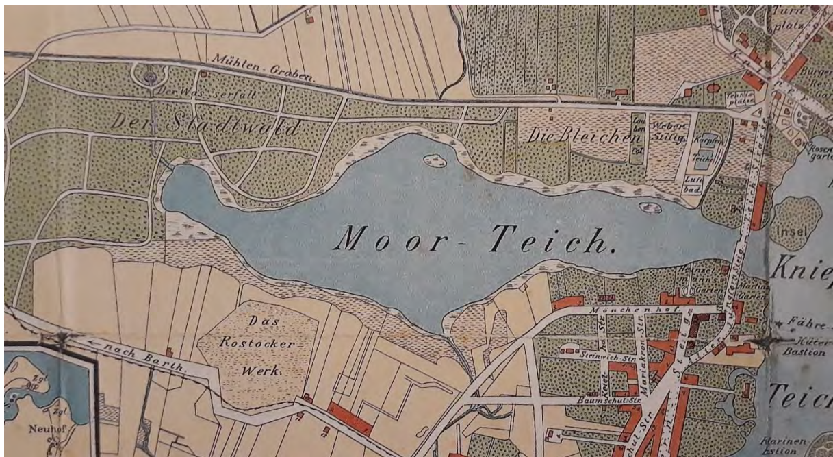
Plan der Stadt Stralsund, 1912

Ursprünglich handelte es sich bei der Anlage des Stadtwaldes um eine 50 ha große bepflanzte Fläche, welche im Laufe der Zeit auf 73 ha erweitert wurde. Ein Stadtplan aus dem Jahr 1912 dokumentiert erstmalig die im Sinne der Bürgerparkbewegung des späten 19. Jahrhunderts als dicht bepflanzter Stadtpark gestaltete Anlage. Die Bereiche westlich und nördlich des Moorteiches sind als Stadtwald bezeichnet und durch ein feingliedriges Wegesystem parkartig angelegt. Ein weit verzweigtes Grabensystem durchzieht die Anlagen.