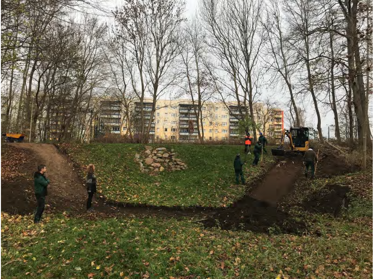
Wegebau am Wasserfall, 2020, Foto: Thomas Struwe