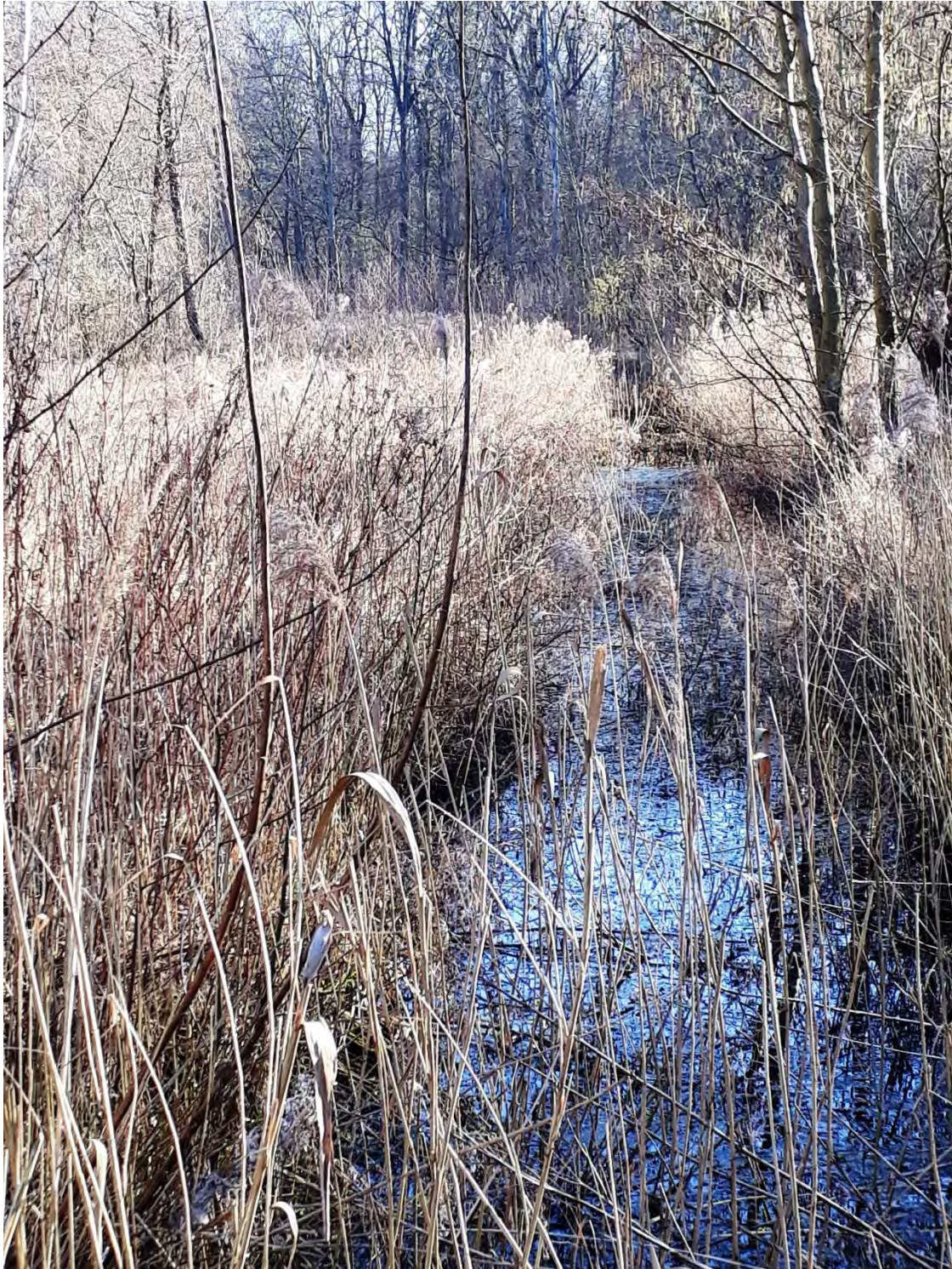
Flächennaturdenkmal im Stadtwald, 2019, Foto: Dagmar Fromme

Der zentrale Bereich des Stadtwaldes – ein unter Naturschutz stehendes Feuchtbiotop – wird heute durch breite wassergefüllte Gräben und den westlichen Ausläufer des Moorteiches fast vollständig von seiner Umgebung abgegrenzt. Es handelt sich hierbei um ein ehemaliges Flachmoor, das aufgrund seiner Unwegsamkeit stets zum wenig erschlossenen Teil des Stadtwaldes zählte und auch gegenwärtig bewusst nur vom Rand her erlebbar, aber nicht begehbar ist. 1987 wurde diese Fläche als Flächennaturdenkmal ausgewiesen und der Sukzession überlassen.