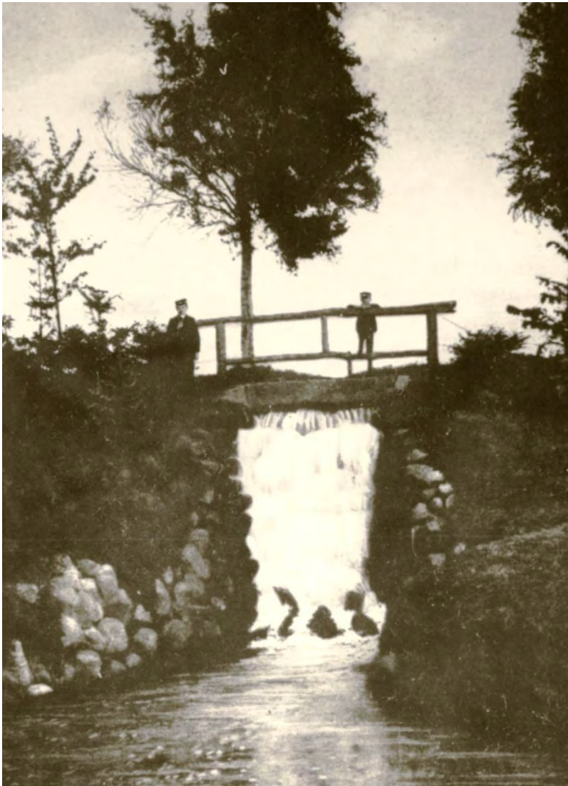
Mühlengraben mit Wasserfall, um 1910, Postkarte