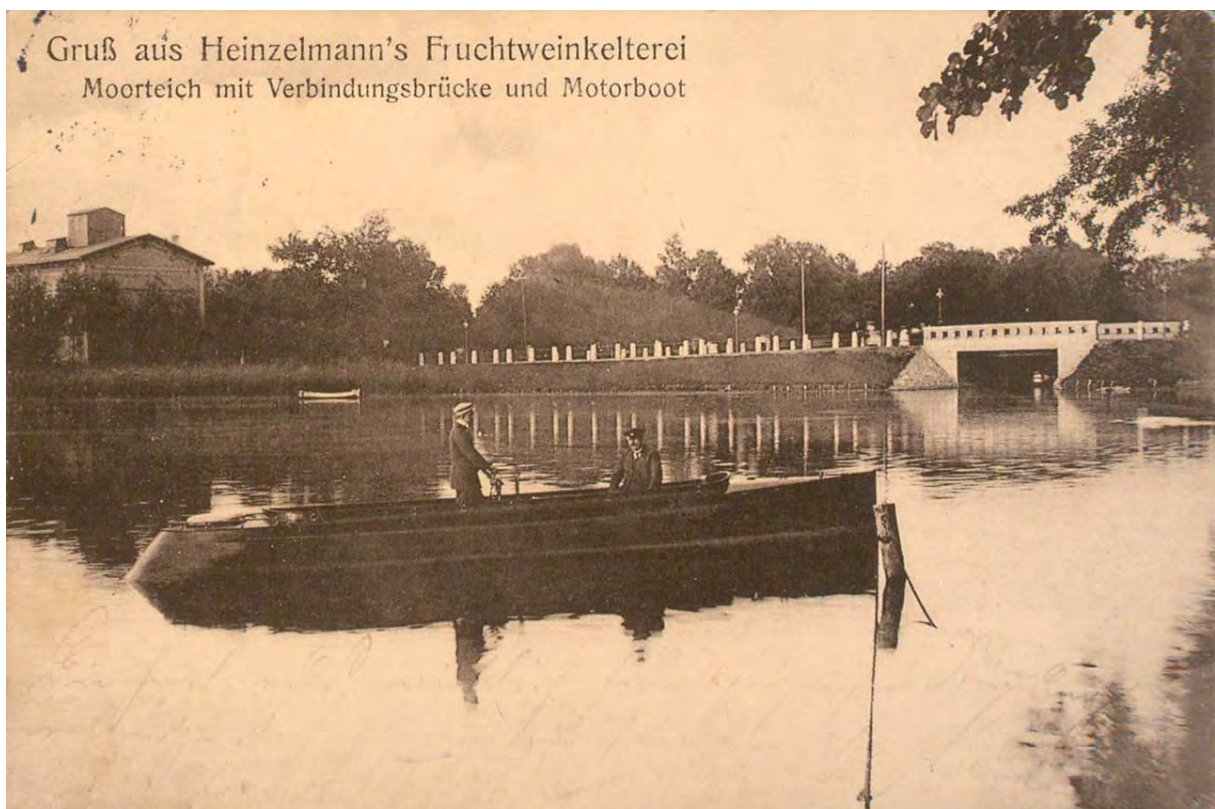
Blick vom südlichen Promenadenweg auf die Moorteichbrücke, 1914

1928 wurde in der Stralsundischen Zeitung am nordwestlichen Ende des Moorteiches, dem sogenannten Papenhagen , ein erhöhter freier Sitzplatz mit Blickbeziehungen zur Altstadt und den Kirchtürmen von St. Nikolai, St. Jakobi und St. Marien beschrieben. Durch Baggerungen sollten die von dem um den westlichen Zipfel herumführenden stark begangenen Spazierweg ausgehenden freien Blicke über die stark zugewachsenen Wasserflächen wieder geöffnet werden.