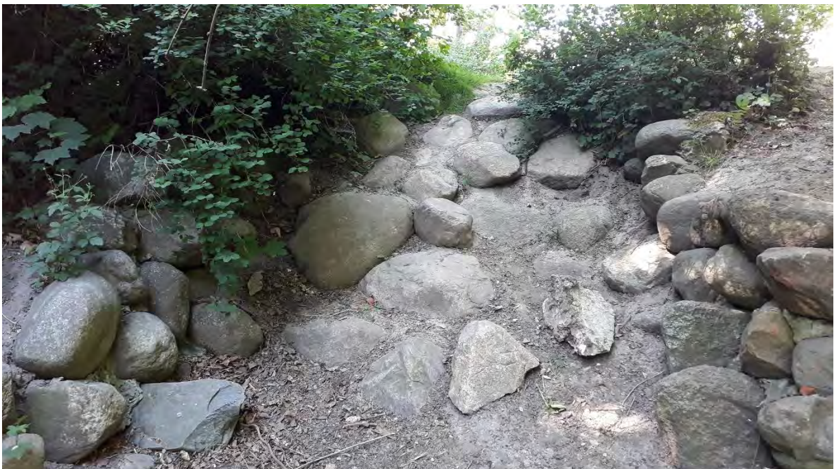
Ehemaliger Wasserfall, 2020, Foto: Angela Pfennig