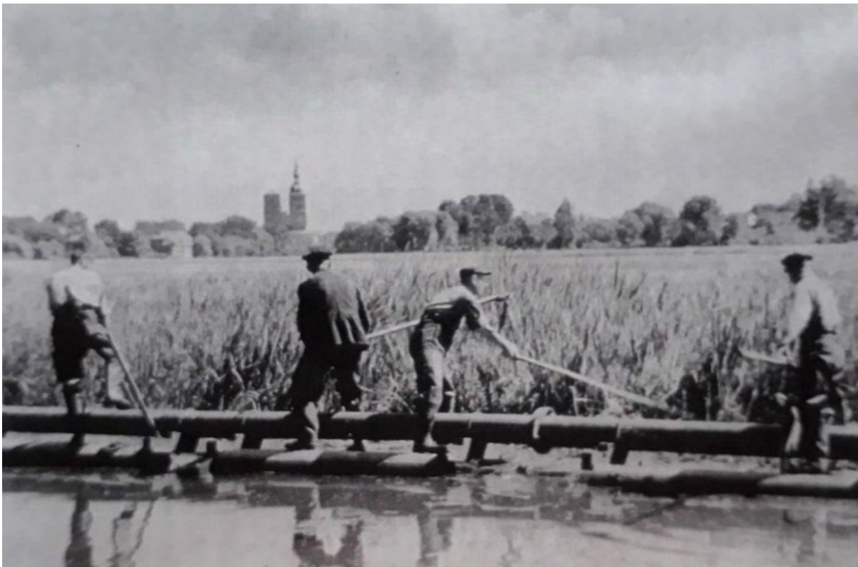
Entschlammungsarbeiten am Moorteich, um 1930

Ein ständiges Problem bei der Pflege der künstlich angestauten Stadtteiche bildete die immer wiederkehrende Verkrautung und Verlandung der Wasserflächen. Bereits aus dem Jahr 1428 sind Beschreibungen über die verschlechterte Wasserqualität der Teiche durch zunehmenden Pflanzenbewuchs überliefert. Umfangreiche Baggerungen sind allerdings erst ab 1859 nachweisbar.