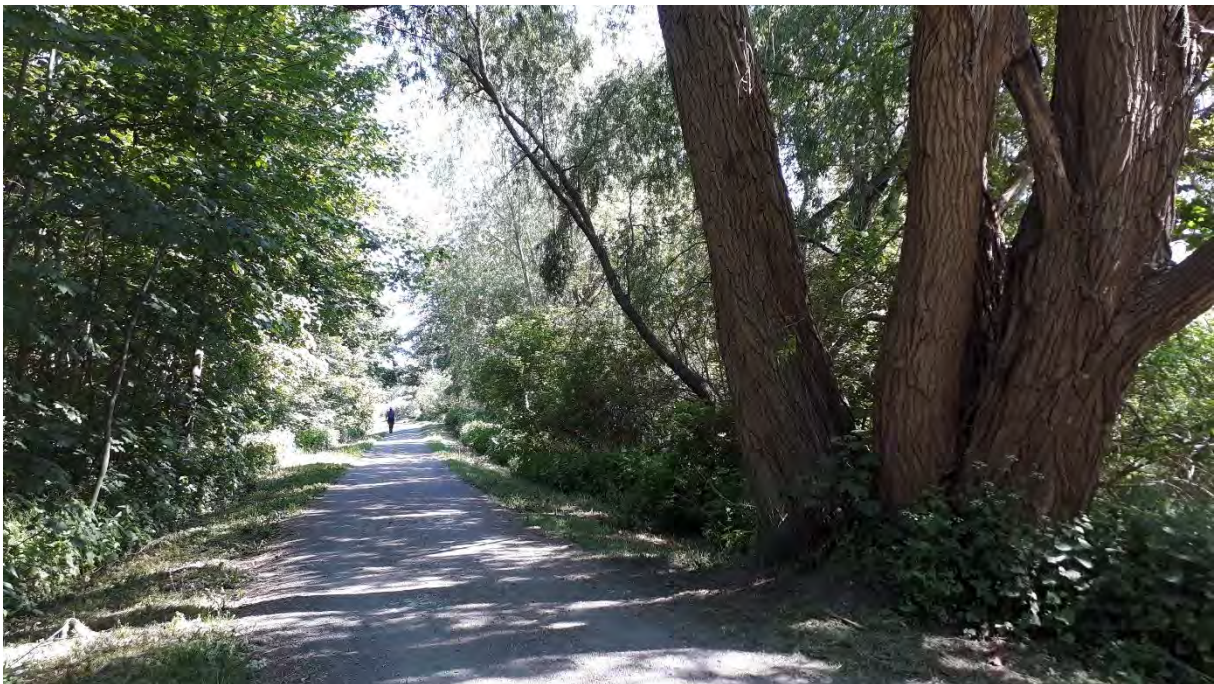
Nördlicher Uferweg, 2020

Während die bereits auf einem Stadtplan aus der Zeit der Wallenstein'schen Belagerung 1628 dargestellten, grabendurchzogenen Moorteichwiesen überwiegend mit Erlen bepflanzt wurden, sollten die höher gelegenen Bereiche mit Buchen, Birken, Eichen und Eschen gestaltet werden.