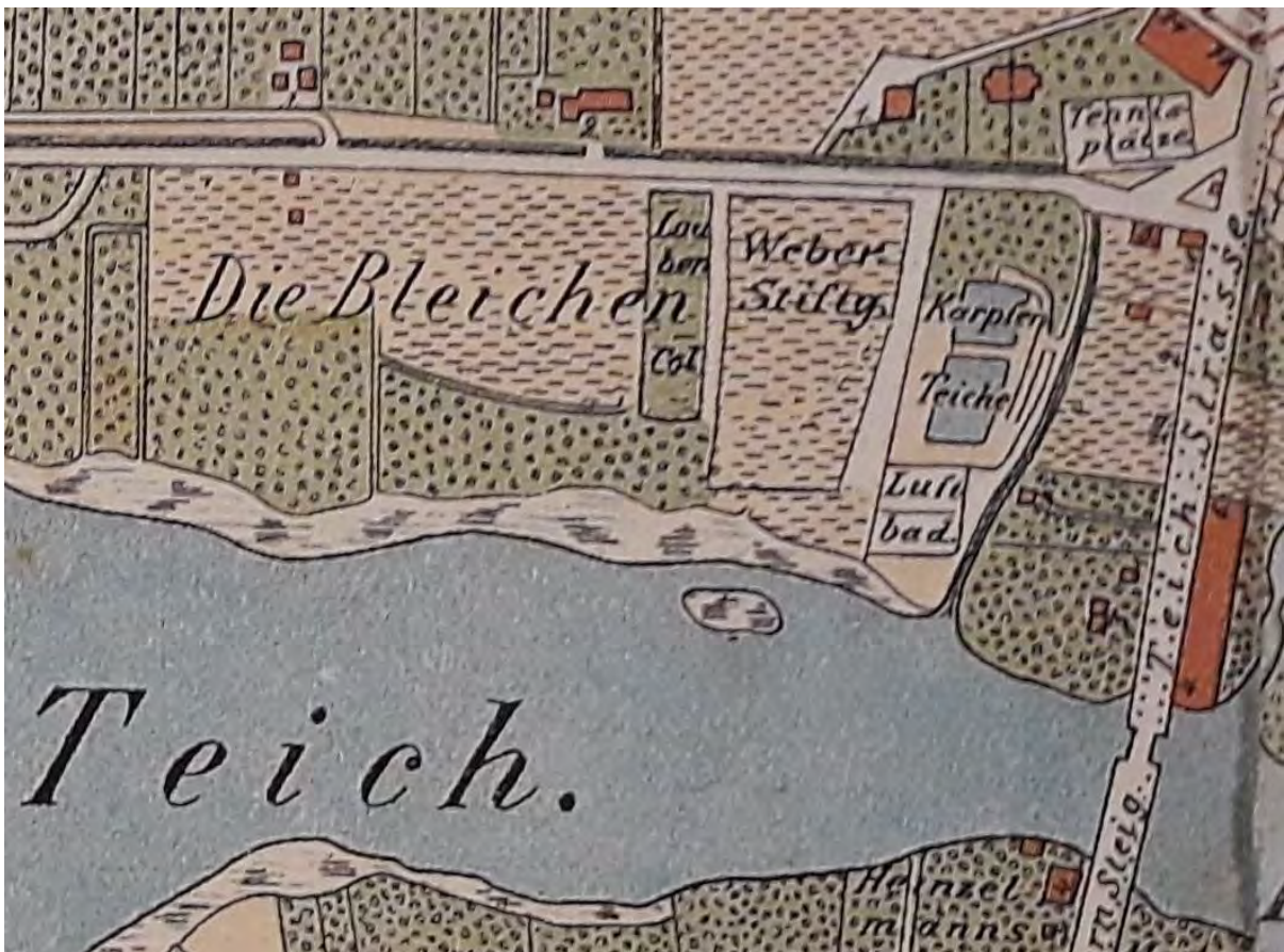
Lufbad, Plan der Stadt Stralsund, 1912, Ausschnitt