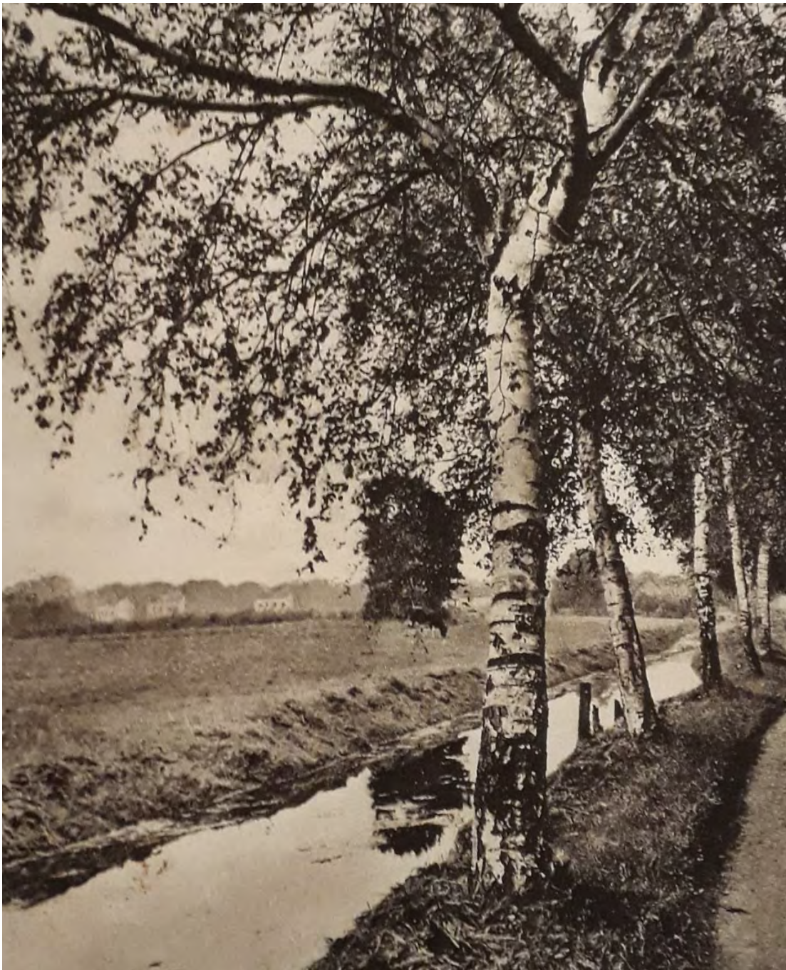
Birkenweg am Mühlengraben, um 1910

Im Zusammenhang mit der zweifachen Sanierung des nördlichen Uferweges zwischen der Ecke Vogelwiese/An den Bleichen und dem Wohngebiet Knieper West 2008 und 2014/2015 wurde die historische Birkenallee am Birkenweg nachgepflanzt. 2024 erfolgte die Sanierung des nördlichen Uferweges zwischen der Ecke Vogelwiese/An den Bleichen und Friedrich-Engels-Straße.