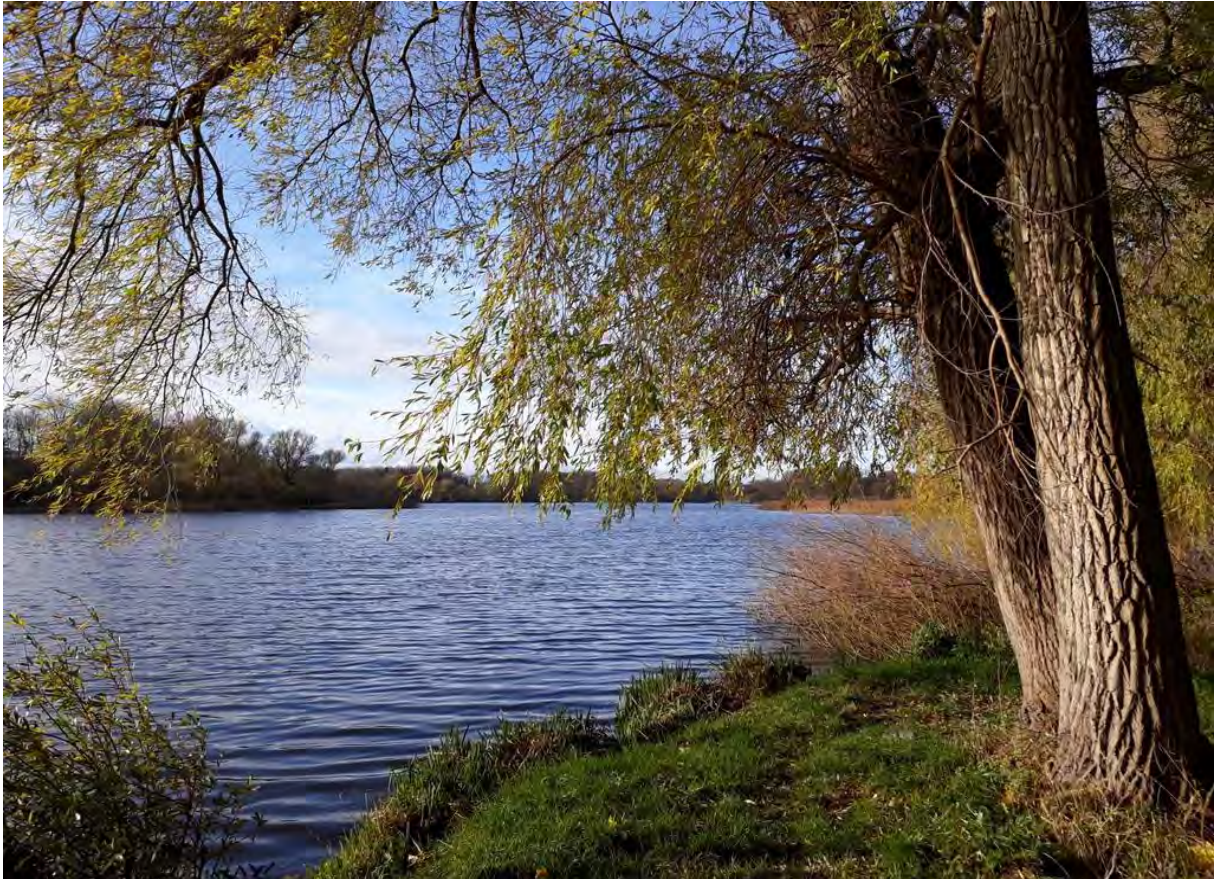
Moorteich und Stadtwald, 2017