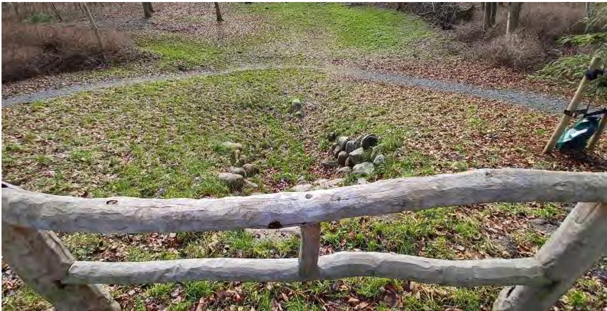
Am Wasserfall, 2023, Foto: Sylke Becker

Ein vom Gemeinnützigen Verein 1915 herausgegebener Führer durch Stralsund empfahl den Besuchern der Stadt neben Rundgängen um die alten Wälle auch einen Spaziergang in den Stadtwald, einer neuen, in guter Entwicklung begriffenen Anlage, sowie einen Ausflug zur Stadtkoppel, einer ländlich gelegenen Gastwirtschaft mit Garten.