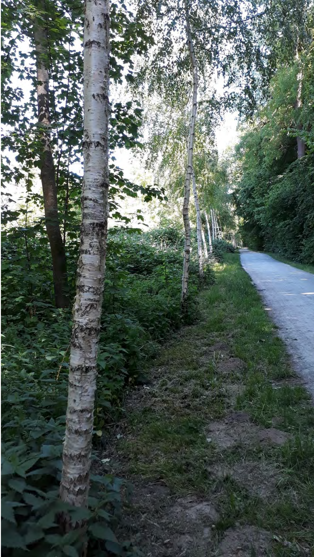
Birkenweg, 2020