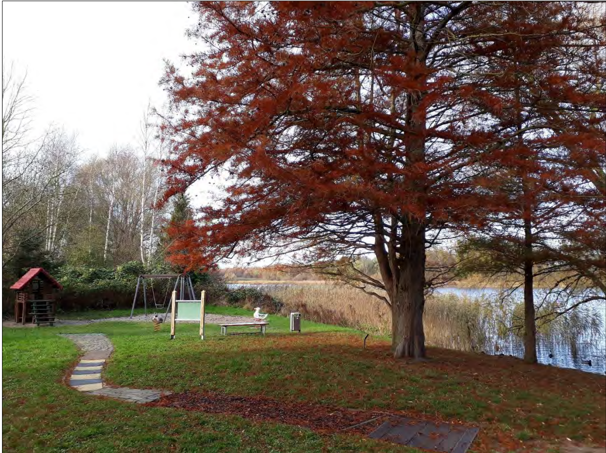
Sumpfyzypresse und Kinderspielplatz am Naturlehrpfad, 2017, Foto: Angela Pfennig

Am südlichen Moorteichufer wurden ab 1979 ein dendrologischer Naturlehrpfad – hier wachsen unter anderem Stieleichen, Silberweiden, Sumpfyzypressen und Eschen – und in der Nähe der Einmündung der Mariakronstraße ein Rhododendrongarten mit Sitzplatz angelegt, der in seiner Formgebung an den Resten der Betoneinfassung bis zum Beginn des 21. Jahrhunderts erkennbar war. Beide Anlagen sind als Versuche zu werten, die ehemaligen gestalterischen Aspekte des Stadtparks neu zu beleben, das Landschaftsbild zu bereichern und somit den Erholungssuchenden reizvolle Naturerlebnisse zu bieten.