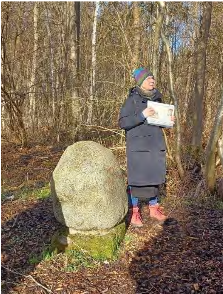
Fliegergrab Hans-Ernst Meyer, 2023

Der Zweite Weltkrieg hinterließ zahlreiche Schäden an den Baumbeständen. In der Nähe des Zoos befindet sich das Fliegergrab des 1945 über dem Stadtwald abgestürzten Piloten Hans-Ernst Meyer (1923-1944).