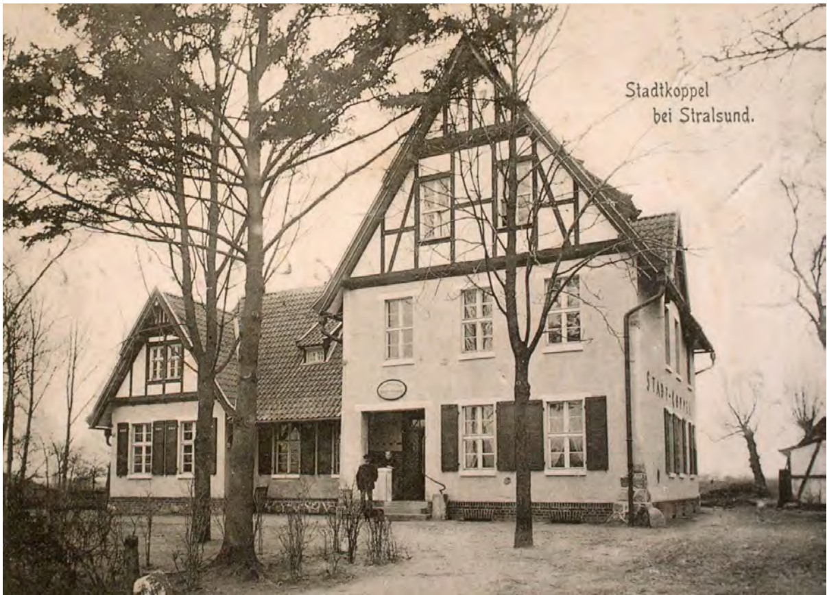
Ausfluglokal Stadtkoppel, 1910, Stadtarchiv Stralsund