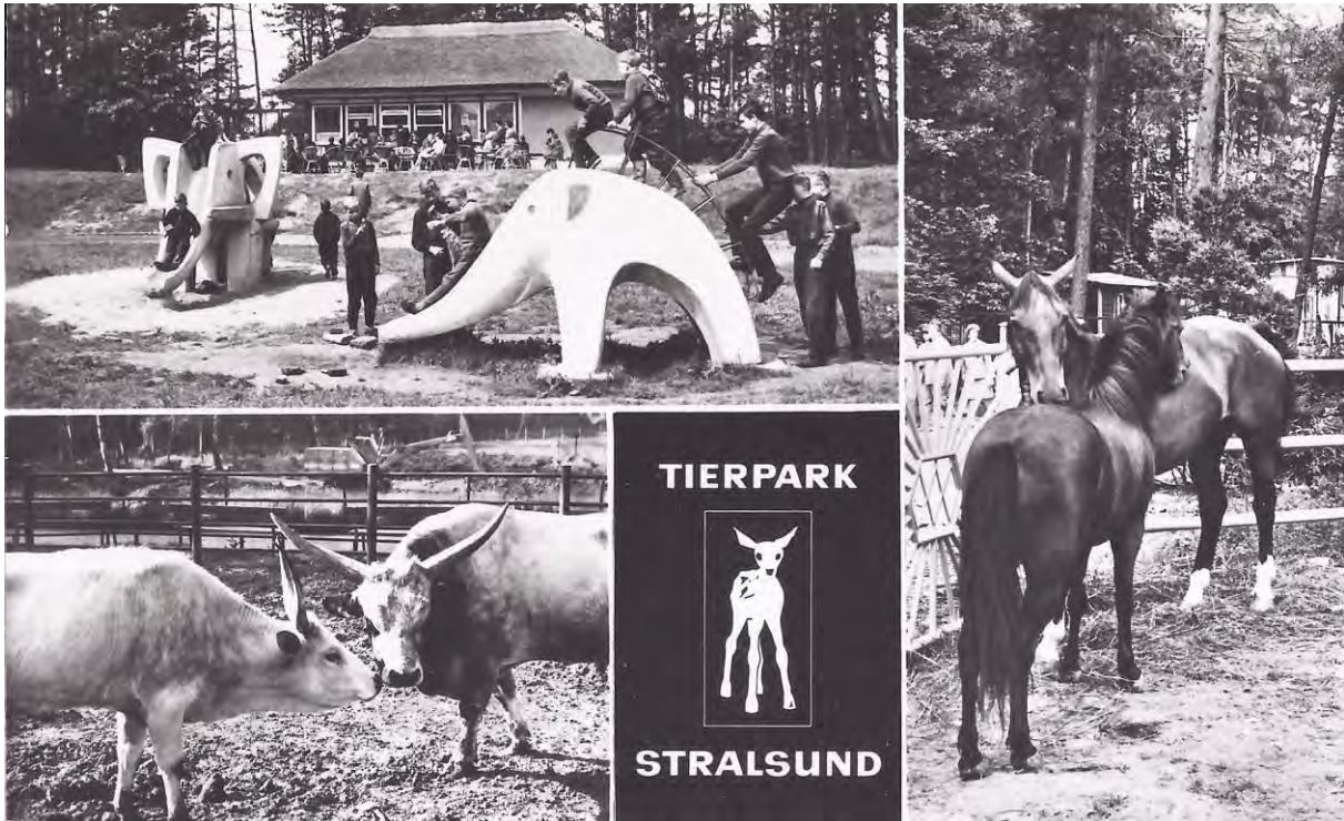
Tierpark am Stadtwald, um 1970, Postkarte

Olejniki (*1930) im westlichen Teil des Stadtwaldes auf einer Fläche von ca. 15 ha mit dem Bau des Tierparks begonnen, der heute als Zoo nach wie vor sehr beliebt ist.