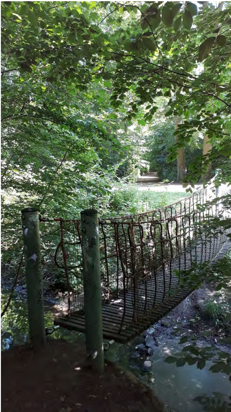
Holzbrücke im Hochwald, 2020, Foto: Angela Pfennig

2005 wurde der südliche Moorteichweg nach Planungen des Stralsunder Landschaftsarchitekturbüros Olaf Petters komplett saniert. Ein Jahr später entstanden verschiedene Spielstationen nach Entwürfen durch die Stralsunder UmweltPlan GmbH , zum Beispiel an der Mariakronstraße und auf der Höhe des Norma Marktes am Carl-Heydemann-Ring. Eine schwingende Holzbrücke überquert den Graben 3 in Nähe der Barther Straße. Unweit davon lädt ein Pavillon auf einer Lichtung zur Rast ein.