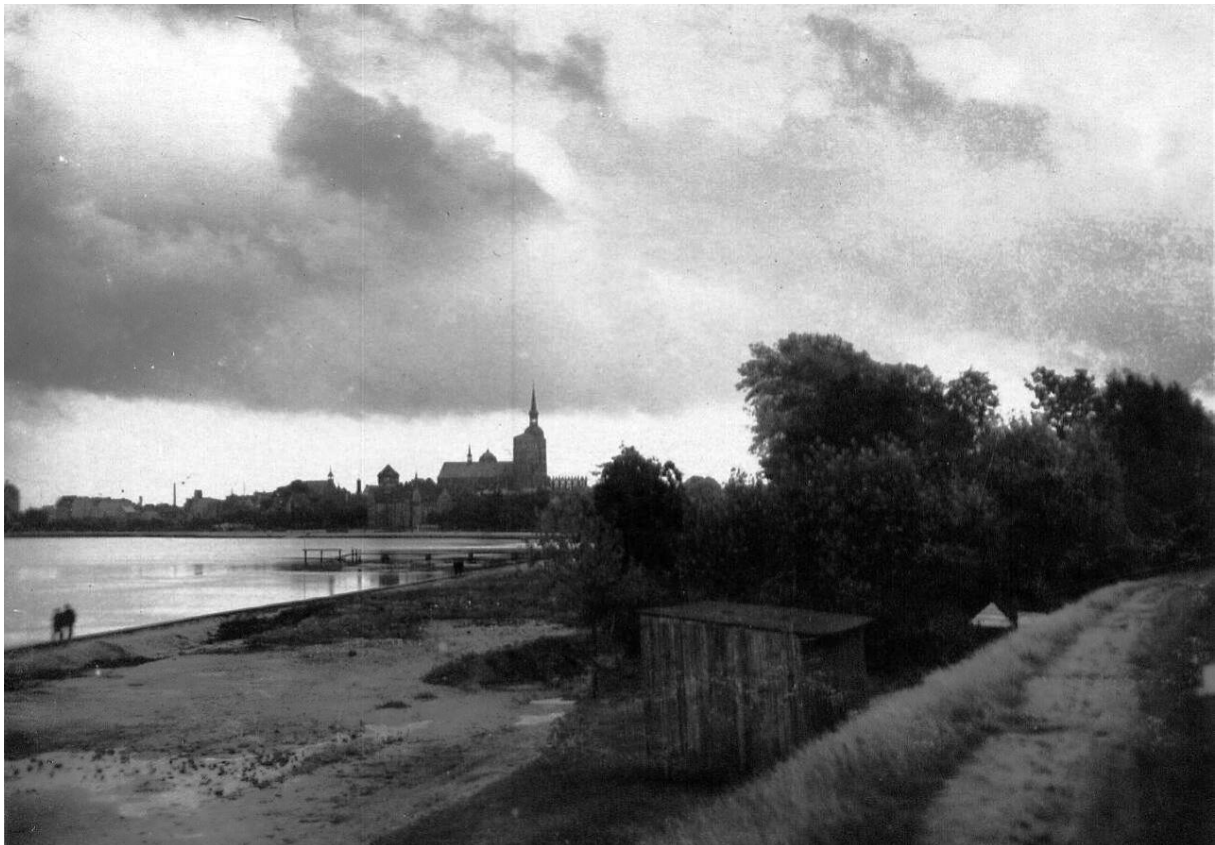
Knieperstrand am Hohen Ufer, 1910

Bis etwa 1900 reichten die im Gelände abfallenden Grundstücke entlang der Sarnowstraße mit weitem Blick über den Sund bis an den in jener Zeit noch natürlichen Strand.