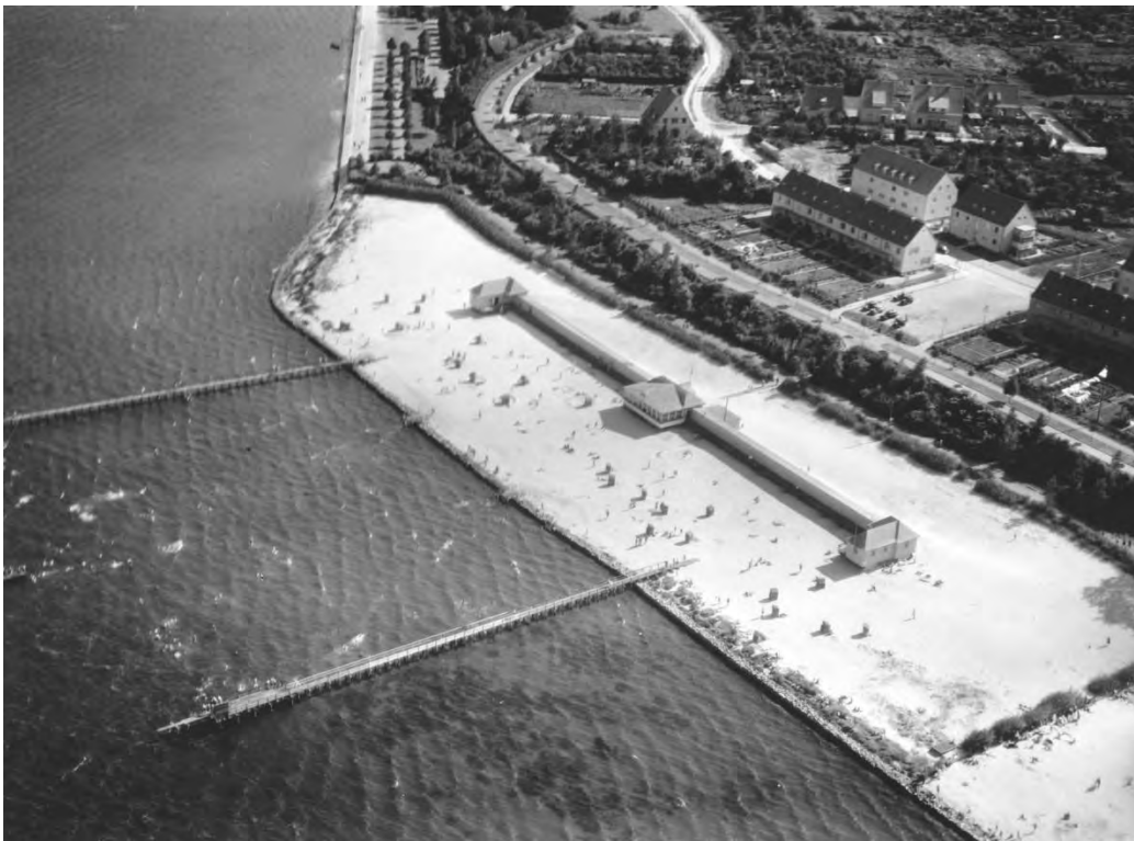
Badeanstalt Stralsund, 1938, Luftbild