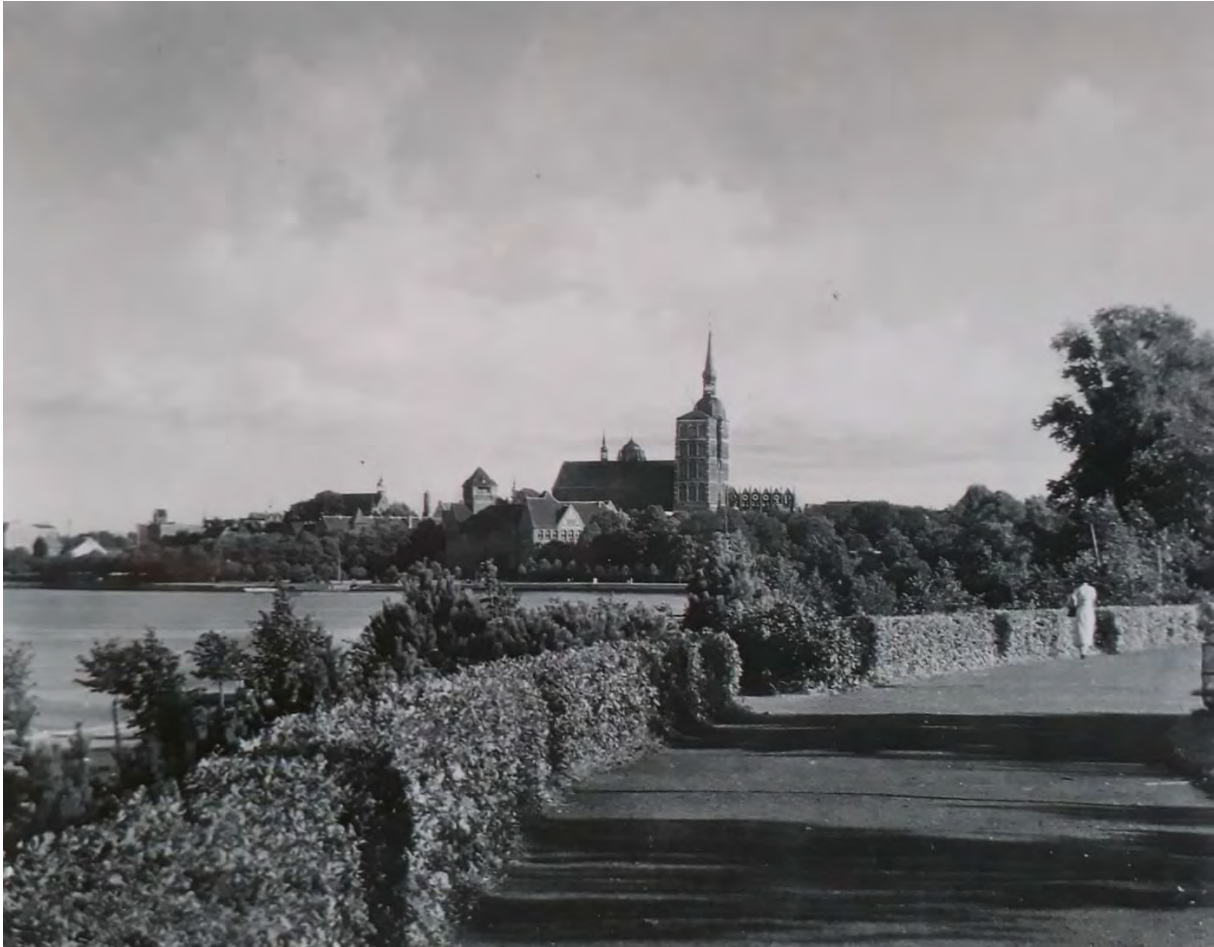
Hohes Ufer, um 1935, Postkarte

Eine geschnittene Hainbuchenhecke begrenzte den hohen Uferweg zur Böschung hin. Der Zustand der Wege sollte ein Begehen dieses Spazierweges mit seinen herrlichen Ausblicken auf die Insel Rügen und die Stralsunder Altstadt bei jeder Witterung ermöglichen. Der Abstieg vom Hohen Ufer auf den unteren Strandweg erfolgte mittels einer geschütteten Rampe.