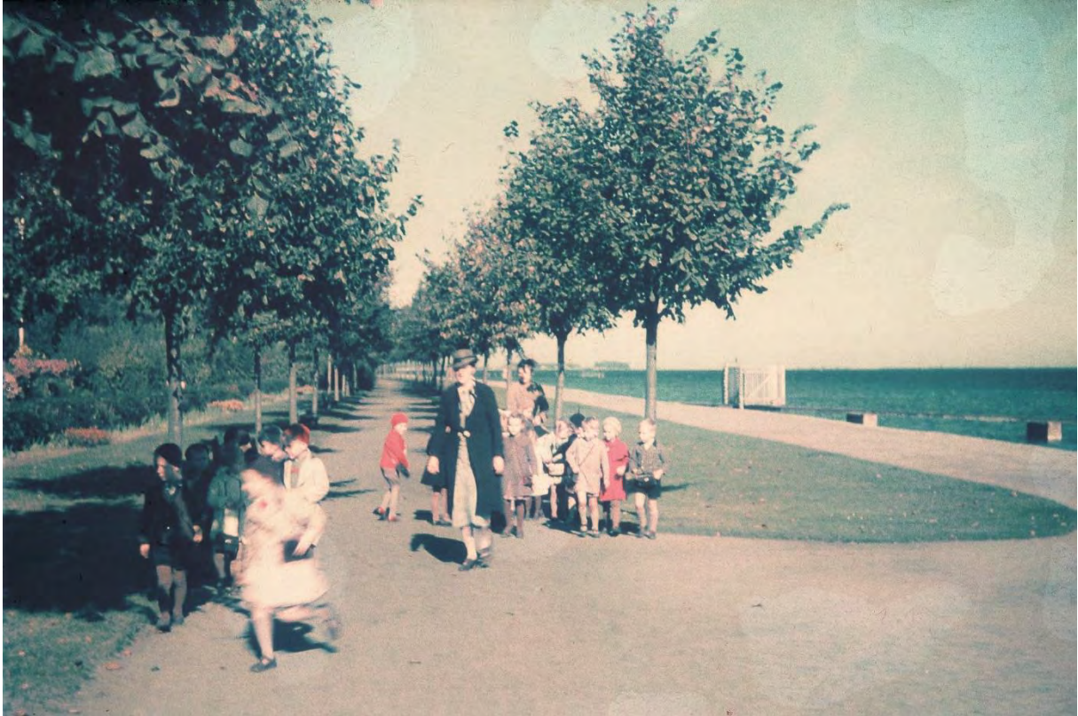
Lindenallee am Hindenburg-Ufer, um 1935, Foto: Hans Winter