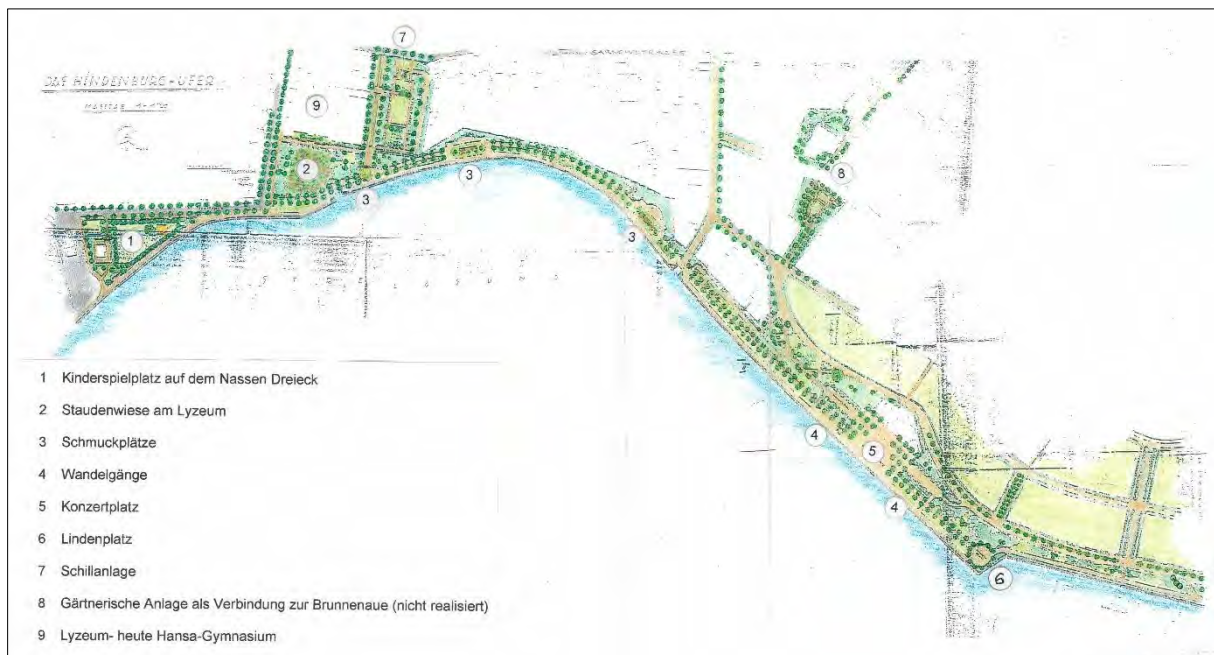
Das Hindenburg-Ufer, 1927, Entwurfsplan: Hans Winter, koloriert und Legende: Angela Pfennig, Hansestadt Stralsund, Amt für Planung und Bau

Gartenbau- und Gewerbe-Ausstellung Liegnitz (GUGALI), in der ca. 30 Städte Pläne und Modelle ihrer Grünanlagen ausstellten, vertreten war und unter anderem einen Schauplan von der Hindenburg Promenade zeigte.