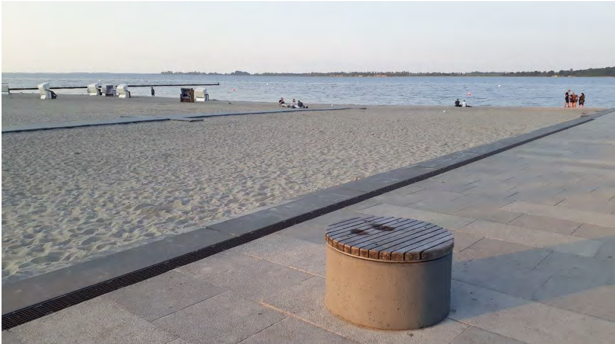
Strandbad, 2021, Foto: Angela Pfennig

In den Jahren 2010/2011 wurde der Bereich nördlich der historischen Badeanstalt als Strandbad mit feinem Sand und Spielstationen gestaltet. Der neu angelegte befestigte Platz am Wasser zwischen Strandbad und künftigem Freizeitbereich hat sich zu einem beliebten Treffpunkt zu jeder Jahreszeit entwickelt. Die Verlängerung der Promenade bis zum Strandbad erfolgte 2021/2022. Es wurden die Spundwand erneuert und ein neuer Promenadenweg mit Wassertreppe angelegt. Die Umgestaltung der ursprünglichen Seebadeanstalt in einen Freizeitbereich wird eine städtische Bauaufgabe der nächsten Jahre sein.