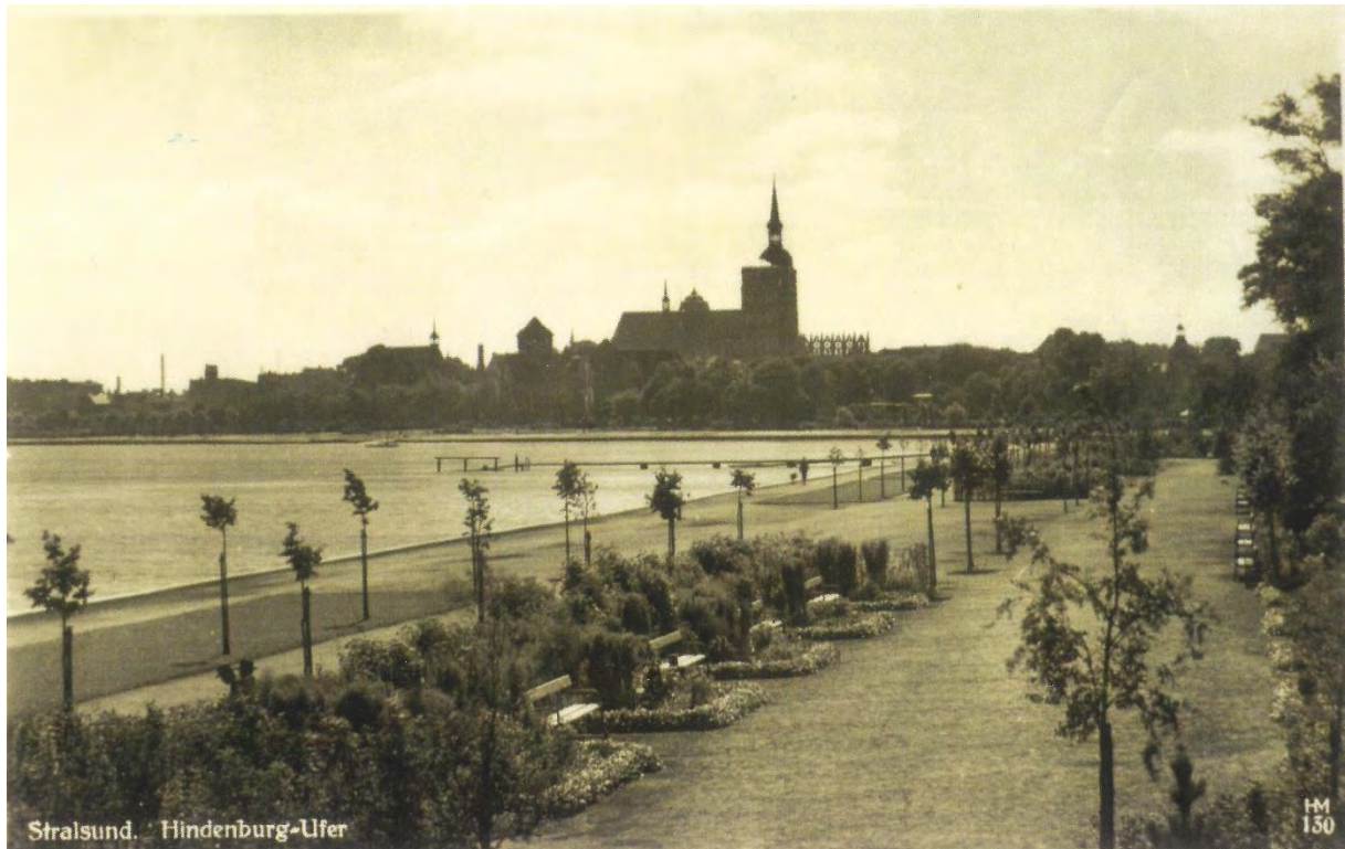
Wandelgänge und Konzertplatz, um 1930, Postkarte

Die Linienführung der Alleen unterstreicht die großzügige, bogenartig geschwungene Uferbefestigung, welche die Wasserlandschaft bis zur Altstadt führt. Die Sundpromenade fungiert hierbei als Schnittpunkt zwischen Natur und Baukunst, einem wesentlichen Charakteristikum der Hansestadt Stralsund.