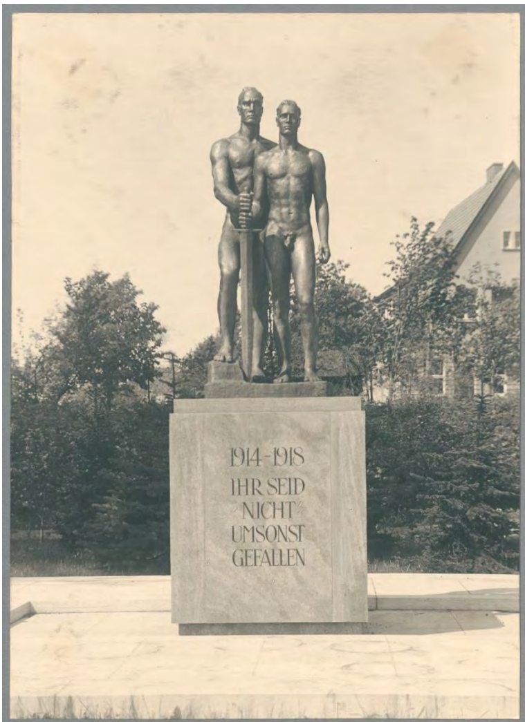
Georg Kolbe, Krieger-Ehrenmal Stralsund, 1934/35, Georg Kolbe Museum