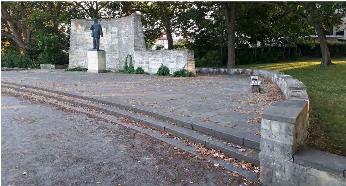
Ernst-Thälmann-Denkmal-Platz, 2021

Nach 1945 begannen tiefgreifende Veränderungen, die die Gartenanlagen in ihrer ursprünglichen gestalterischen Wirkung sehr beeinträchtigten und teilweise zerstörten. Das Nasse Dreieck mit seinem Kinderspielplatz wurde 1955 durch ein Verwaltungsgebäude (heute: Hotel Hafenresidenz) bebaut und die Staudenwiese am Hansa-Gymnasium durch ein Rosenrondell ersetzt. Die beidseitig entlang des Fährwalles/Seestraße zum Sund hinführende Allee wurde entfernt und 1991 nur einseitig nachgepflanzt. Das Rasenrondell als Verbindungsplatz zur Schillanlage wurde aufgegeben und wich einem architektonisch nicht mehr gefassten Platz. Mit dem Bau der Ventspils-Gaststätte in den 1970er-Jahren begannen die Umgestaltung des einstigen Schmuckplatzes zu Hochbeeten und gleichzeitig die Aufgabe der Villengärten Sarnowstraße 7 und 8 zugunsten von Parkplätzen.