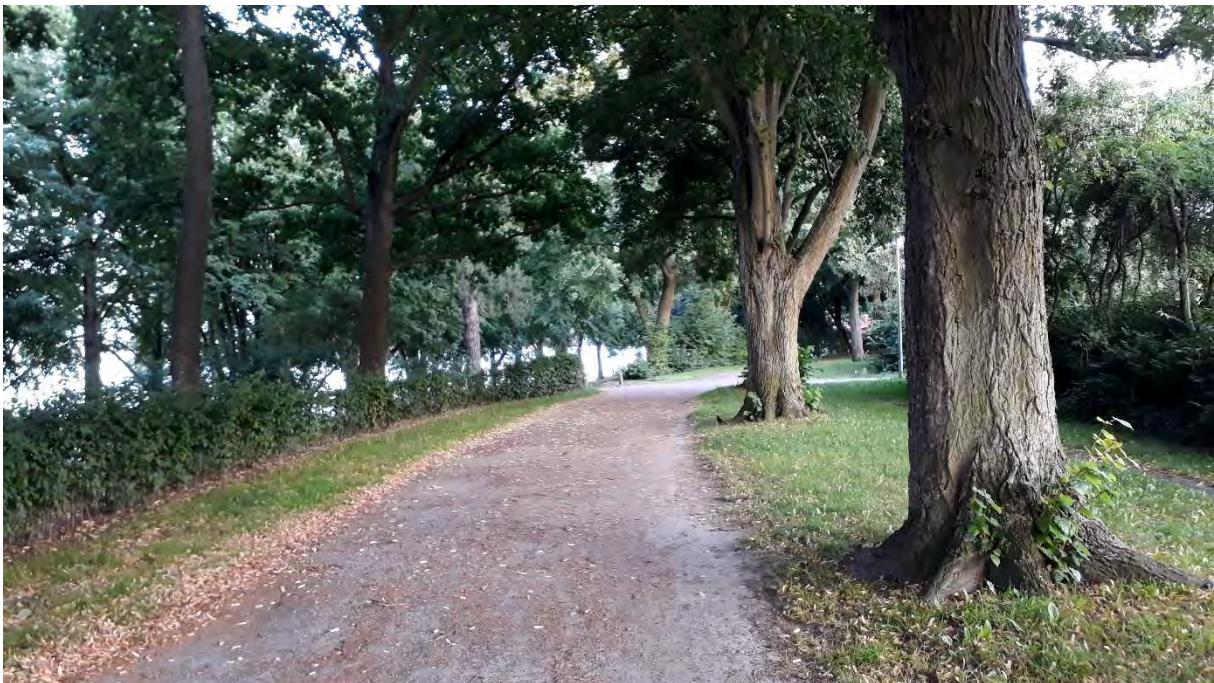
Hohes Ufer, 2021

Seit 2010 erfolgten intensive Pflegemaßnahmen am Hohen Ufer , die aus naturschutzfachlichen Gründen in Abschnitten und über mehrere Jahre umgesetzt wurden. Sie beinhalteten zunächst Rodungs- und Fällarbeiten im Böschungsbereich unter Verbleib einzelner Hochstämme und mehrstämmiger Großsträucher. Als Kontrast zu dem klar architektonisch mit Gehölzen gefassten und gestalteten Promenadenraum des Hohen Ufers wurde im Bereich des Kliffs eine den natürlichen Standortbedingungen angepasste, ökologisch vielfältige Bepflanzung mit Gehölzen und Bodendeckern angelegt. Als seeseitige Begrenzung wurde entlang des Hochuferweges wieder eine Hecke gepflanzt, die im Schnitt gehalten wird und dem Promenadenraum eine räumliche Führung gibt. Um einen Ausblick aus den angrenzenden Gärten zum Strelasund zu ermöglichen, wählte man halbhohere Ziersträucher zur Bepflanzung der Böschung.