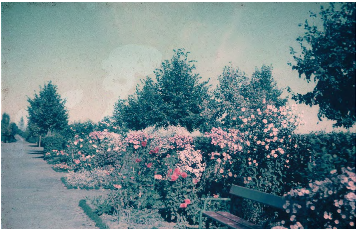
Wandelgänge, um 1935