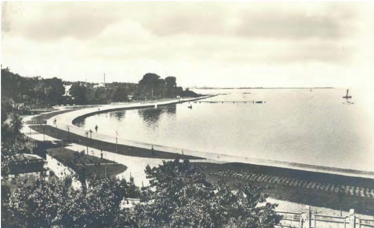
Hindenburg-Ufer, 1931, Postkarte

Ebenfalls um 1930 wurde das Hohe Ufer entlang der Kliffkante an der Hohe-Ufer-Straße (heute: Friedrich-Naumann-Straße) als Promenade für Fußgänger und Radfahrer hergerichtet, wobei eine Lindenreihe mit Rasenstreifen beide Wege trennte.