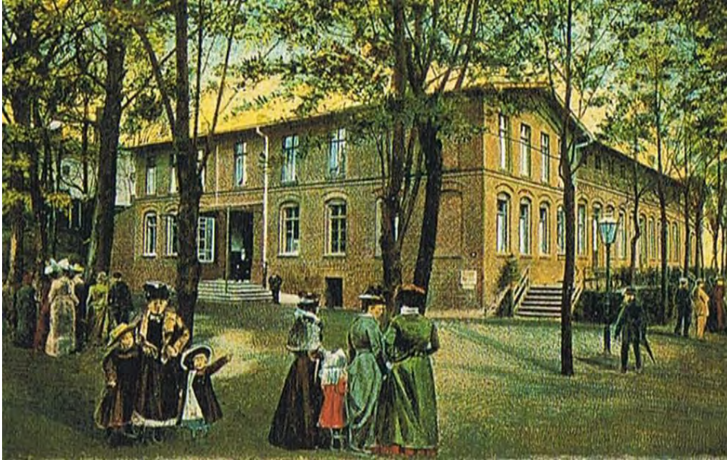
Rühes Konzerthaus und Touristenheim, um 1914, Postkarte