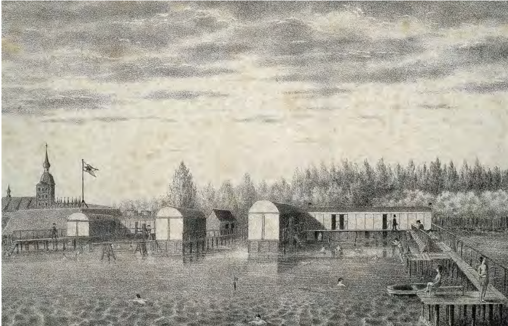
Stralsunder Seebadeanstalten, um 1840, Lithografie, Stralsund Museum

schützte die Seesandaufspülungen. Die Stralsunder Badeanstalt zählt zu den in der Weimarer Republik im Sinne der Moderne vielfach umgesetzten sozialen Freiraumkonzepten, denen der Wunsch nach gesellschaftlicher Erneuerung durch Reformbewegungen zugrunde lag. Als städtische Badeanstalt erfüllt sie bis heute wichtige Funktionen der Gesundheitsvorsorge und Erholung. In ihrem stadträumlichen Bezug bildet sie den Zielpunkt der ab 1928 errichteten und auf sie ausgerichteten Sundpromenade.