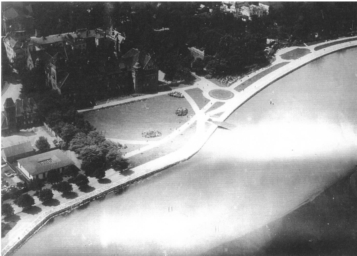
Hindenburg-Ufer am Lyzeum, um 1930

Ab 1928 entstand mit dem Ausbau der Anlagen an der Sundpromenade zwischen Strandstraße (heute: Gerhart-Hauptmann-Straße) und Schwedenschanze im Rahmen von Notstandsarbeiten, ein in der Weimarer Republik verbreitetes Programm von Arbeitsbeschaffungsmaßnahmen, unter wirtschaftlich schwierigsten Bedingungen ein Gartenkunstwerk von hohem Rang.