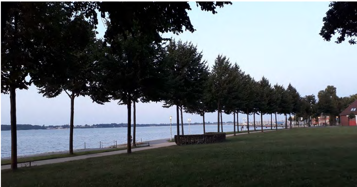
Lindenallee an der Hansa-Wiese, 2021

Nach der Sanierung des Hansa-Gymnasiums und im Zusammenhang mit der Wiederherstellung der Schillanlagen begannen 2003/2004 im Bereich der Hansa-Wiese die ersten Sanierungsarbeiten an der Sundpromenade. Hier wurden unter anderem die Lindenallee zwischen Seestraße und Schillanlage, die Wege und der Rundplatz komplett erneuert.